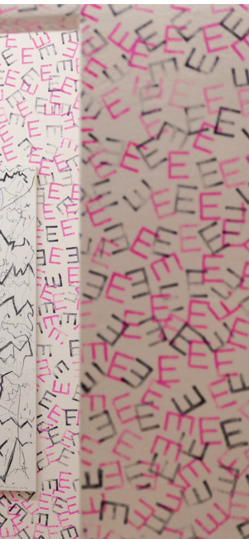
„Raum“ von Christoph Hinterhuber in der Meraner es-gallery: Michelangelo hat die Sixtinische Kapelle nicht aus dem Bauch heraus gemalt.

dieses Paradoxon: Man stellt was rein und der Raum wird größer. Zurück zu den 1990er Jahren: Was war denn so schön daran? Die 90er waren eine Zeit der Vermischung, der Auflösung, der Entgrenzung. Eine Zeit der Möglichkeiten, der Variante. Quer durch die Welt temporäre autonome Zonen (Hakim Bey), Tests und Experimente gegen Realität. Ziemlich radikal in einem metapolitischen Sinne und für mich eine genuin futuristische Lebensform. Allgemein mag das mit der politischen Situation zu tun gehabt haben und einer Erleichterung nach dem Ende der (neurotischen) Blöcke: Offene Räume und als Draufgabe noch die digitale Revolution. War doch super. Dann kam 9/11 und die Reptilienmenschen haben alles eingesackt. Der absterbende Ast der Postmoderne – was meinen Sie damit? Das gefühlte Ende einer künstlerischen Ära, in der alles möglich war, einen gesellschaftlich-politischen Befund? Die Fragen der Gegenwart haben sich verändert, dadurch auch Fragestellungen in der Kunst. Vieles greift nicht mehr, ist von einem allgemeinen zu einem spezifischen Interesse mutiert. Auf eine Ära kann ich leider nicht zurückgreifen.